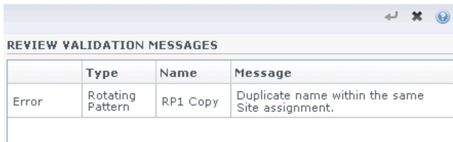
Figure : message d'erreur relatif aux modèles de rotation